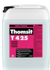
T 425 Tackifier