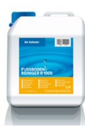
Fußbodenreiniger R 1000